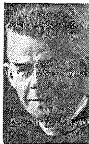
MGR J. CARDIJN

Tu peux être frère de la J.O.C. canadienne qui depuis 25 ans travaille de mille et une façons au bonheur, au salut de la jeunesse travailleuse. Grâce au dévouement, à l'engagement de jeunes comme toi, la J.O.C. est maintenant une force irrésistible qui peut réaliser beaucoup pour les jeunes. Elle est vraiment au Canada une ECOLE de FORMATION, un SERVICE, un CORPS REPRESENTATIF.